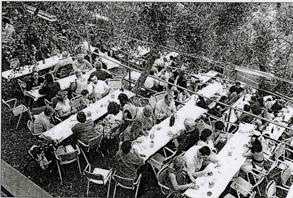
Stasera cena in piazza a base di prodotti tipici locali tra le case di Valloria

il paese torna ALL'OTTOCENTO Diano San Pietro ricorda il patrono con la fiera e la musica popolare